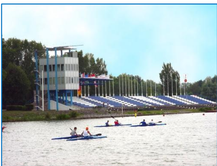
Im Jahr 2000 war der erste Teil der Sanierungs- und Modernisierungsmaßnahmen angeschlossen.

Exponate, Bilder und Geschichten rund um die Regattastrecke „Beetzsee“. All jene, die vor über fünf Jahrzehnten an der Planung und am Bau der Sportanlage beteiligt waren, in den Folgejahren als Organisatoren und Helfer bei nationalen und internationalen Regatten dabei waren, auf dem Beetzsee sportliche Erfolge erzielten oder sich auf andere Weise mit der Brandenburger Regattastrecke verbunden fühlen, sind aufgerufen, dieses ambitionierte Projekt zu unterstützen. Wer noch Eintrittskarten, Programmhefte, Plakate und andere Erinnerungsstücke von großen Sportveranstaltungen besitzt, im privaten Fotoalbum alte