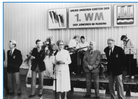
Die Premiere der Ruder-Junioren-WM fand 1985 in Brandenburg an der Havel statt.

Erinnerungsstücke von großen Sportveranstaltungen besitzt, im privaten Fotoalbum alte Aufnahmen von der Regattastrecke findet oder über längst verschollen geglaubte Dokumente verfügt, der kann sich per Post, Telefon, Fax oder Mail und natürlich auch ganz persönlich an den Chef der Regattastrecke „Beetzsee“ wenden.